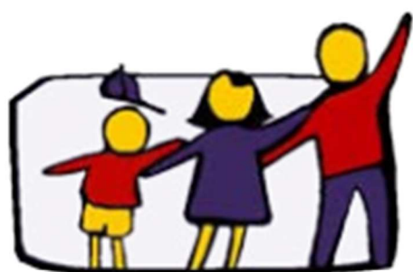
Fundación Paula Jaraquemada A.